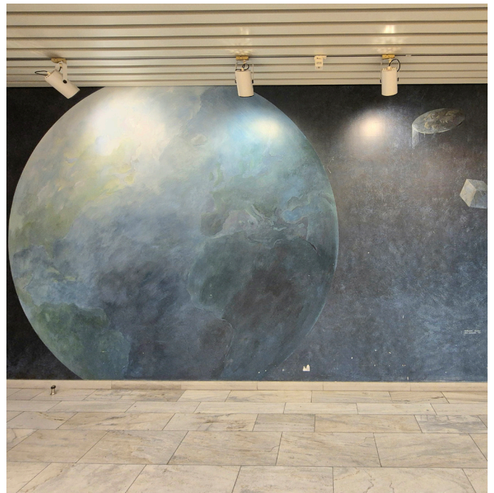
Del av konstverket Världsbild: Världar av Hans Lindström, från 1984. Konstverket är ett av flera i förhallarna till byggnadens huvudtrapphus