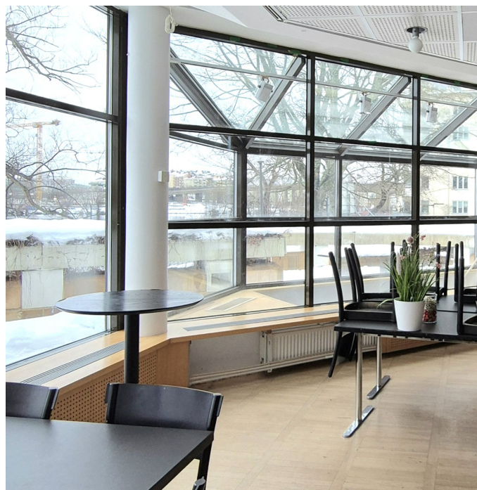
Karaktäristiska och värdeskapande fönster i matsalen, typiska för det tidiga 1980-talets postmodernism.