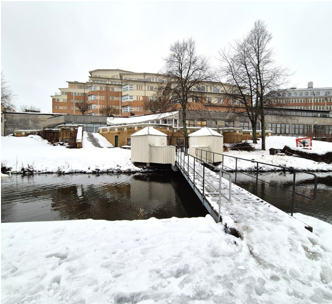
Lärarnas Hus i januari 2026, sett från Lärarbryggan som anlades i samband med husets uppförande på 1980-talet.

Lärarnas Hus uppfördes mellan 1982 och 1984, på uppdrag av Sveriges Lärarförbund. Ansvarig arkitekt var Allan Westerman vid Coordinator Arkitekter AB. Lärarnas Hus ingår i den kontors- och industribebyggelse som uppfördes på Stora Essingens norra udde från 1940-talet och fram till 1984. Från dess invigning 1984 och fram till 2022 ägdes och nyttjades Lärarnas Hus av Sveriges Lärarförbund/Lärarförbundet. För en mer utförlig bakgrundshistorik hänvisas till den kulturmiljöutredning som hör till underlaget för den nyligen antagna detaljplanen.