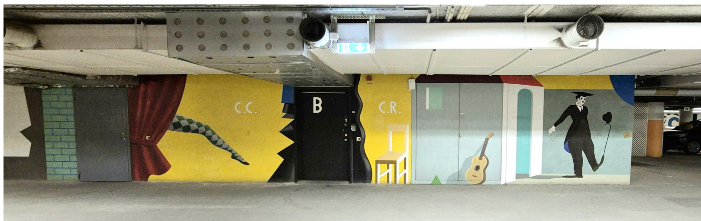
Byggnadsanknuten konst i garaget.