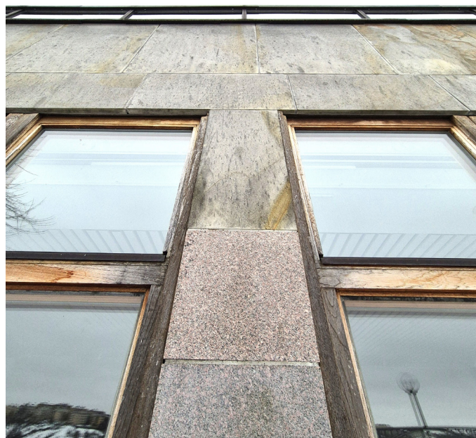
Möten mellan fasadens exklusiva material.

Sammantaget bedömer undertecknande antikvarier att byggnaden är att betrakta som särskilt värdefull enligt PBL 8 kap 13 § samt att det finns stöd att neka rivning finns. (PBL 9 kap 34 § i sin lydelse före 1 december 2025 samt PBL 9 kap 76 § i sin lydelse efter 1 december 2025).