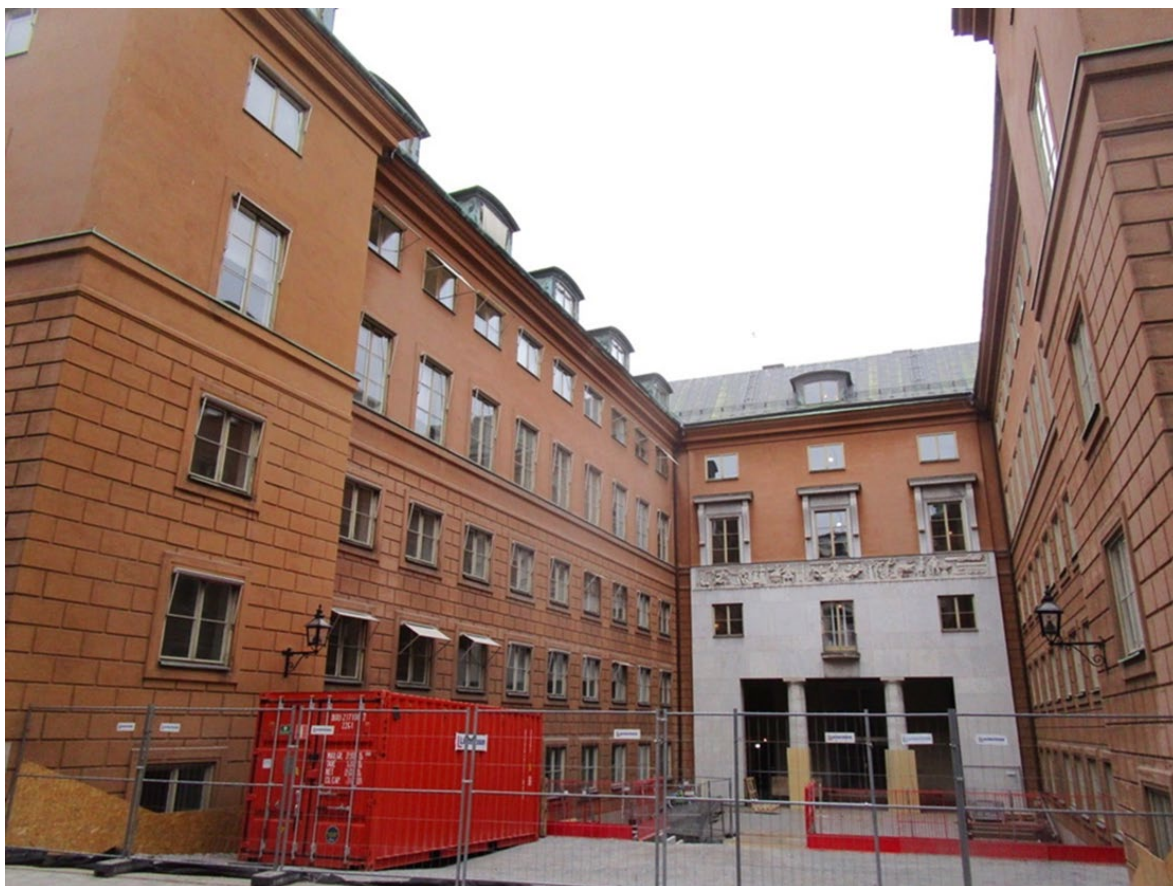
Stora gården och huvudentrén, foto Fredrik von Feilitzen, april 2019