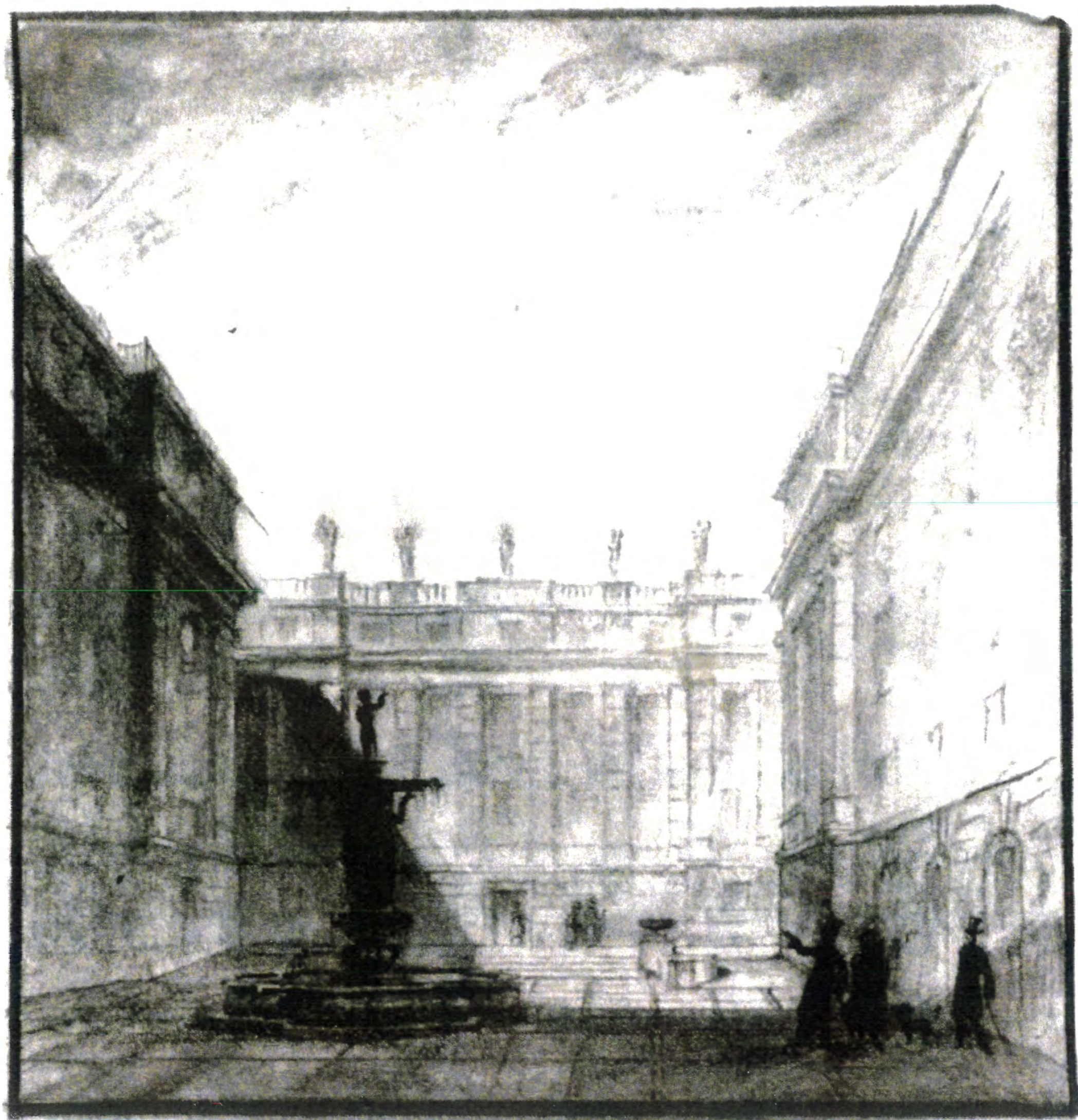
Gustaf Clason Stora gården mot Bondeska palatset