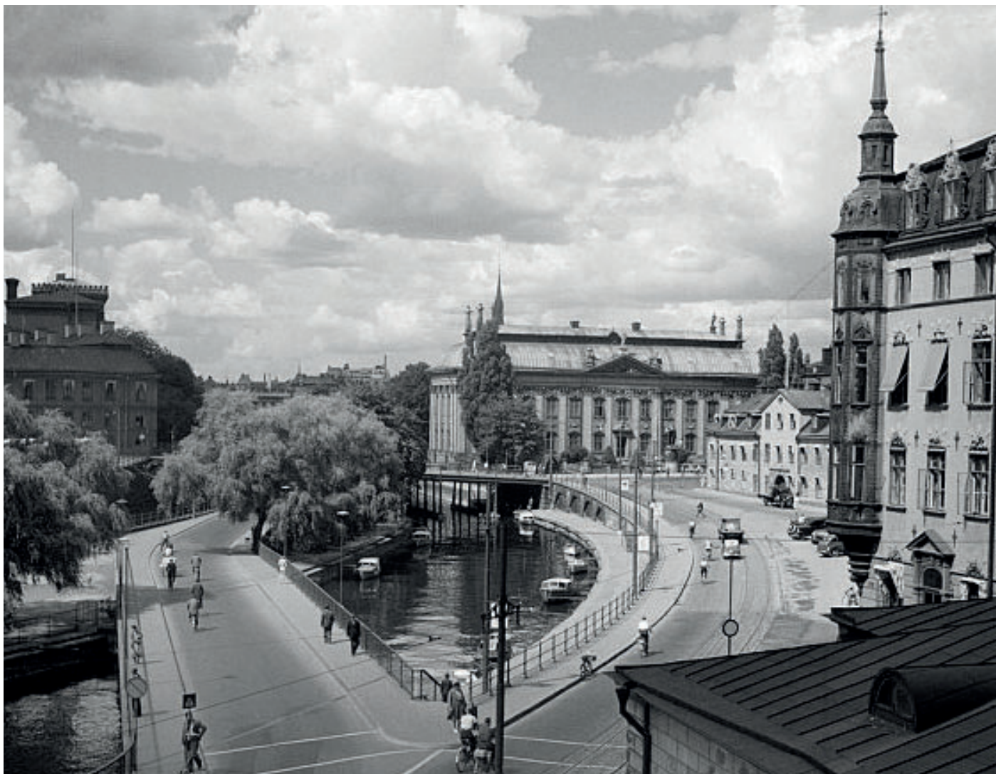
“Slingerbultsleden” eller ”Västra Skeppsbron” fanns 1945-55